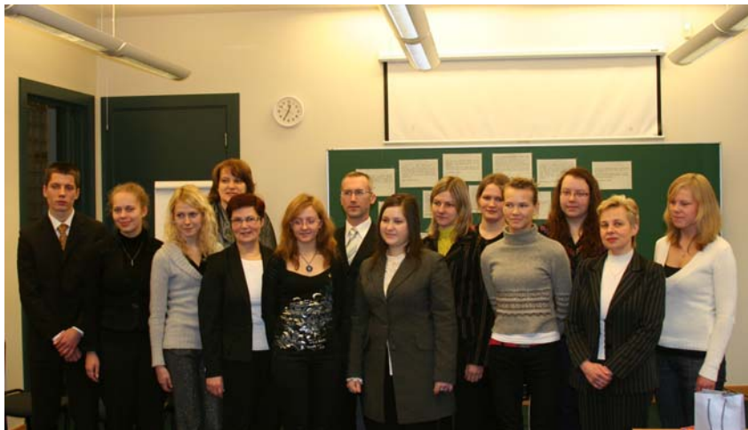
Foto: Godalgoto darbu autori viesojas KNAB un tiekas ar žūrijas pārstāvjiem.

Konkursa uzdevums bija ne tikai kritizēt, bet pats galvenais – formulēt skaidrus pamatnoteikumus, kas būtu obligāti jāievēro visiem valsts pārvaldē strādājošajiem.